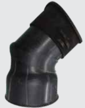
Tee de inserción de 45°