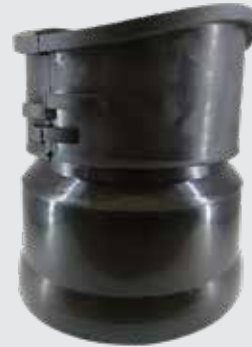
Tee de inserción