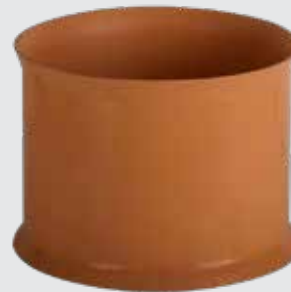
Cople de reparación